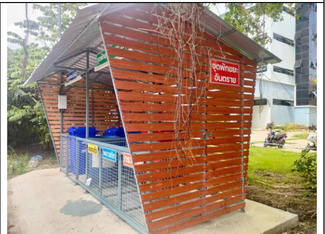
จุดพักขยะอาคารเรียนรวม 19 และอาคาร 58