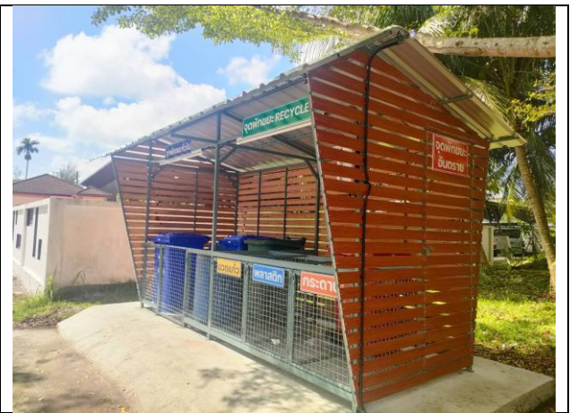
จุดพักขยะอาคาร 1, 29, 39, 43