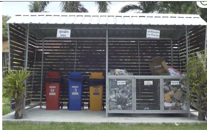
จุดพักขยะอาคาร 74