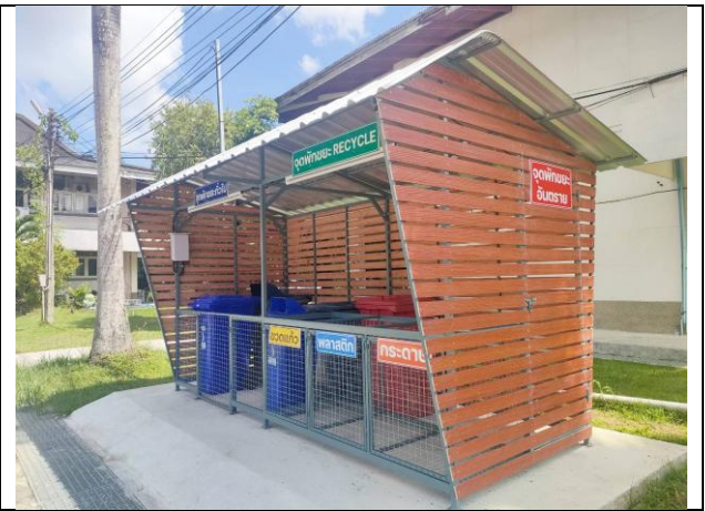
จุดพักขยะอาคาร 2, 4, 13, 14