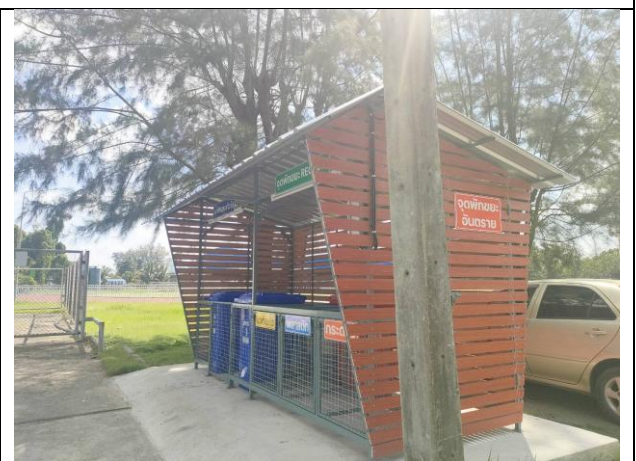
จุดพักขยะอาคาร 9